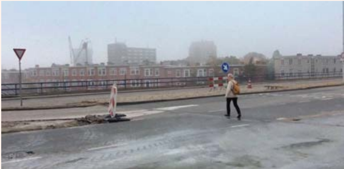
Voorbeeld filmfragment Den Haag: knelpunt voor voetgangers in de openbare ruimte.

In deze handreiking gaan we uit van het model van Age friendly cities and communities van de Wereldgezondheidsorganisatie (WHO, 2007). 1 Dit model onderscheidt diverse aspecten die van belang zijn: voldoende mogelijkheden voor (openbaar)vervoer; toegankelijke gebouwen en schone en veilige openbare ruimte; passende huisvesting; mogelijkheden voor betaalbare en toegankelijke activiteiten; begrijpelijke communicatie en informatie; respectvolle benadering en aandacht voor senioren; maatschappelijke participatie en werkgelegenheid; voldoende voorzieningen van zorg en welzijn (zie afbeelding).